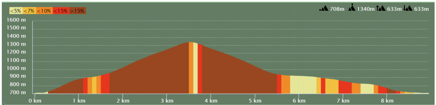
Boucle Marcheurs : 8,9 kms – 630 m